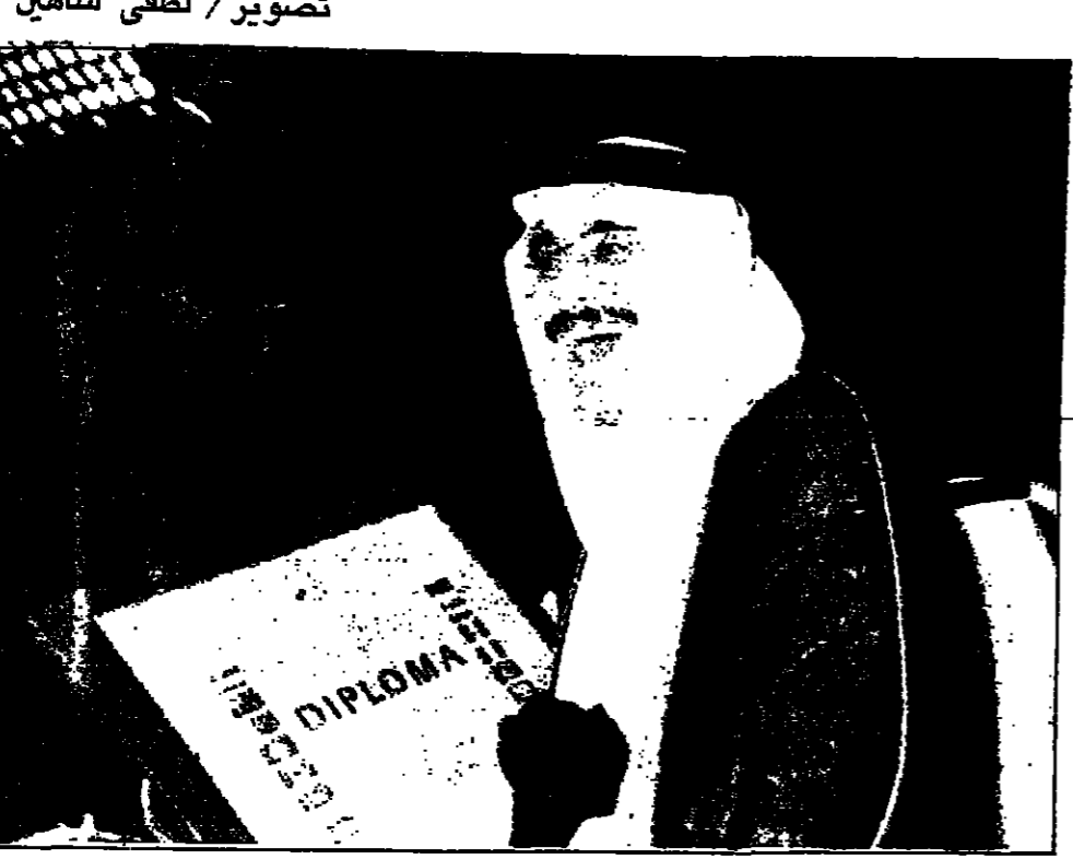
الفيضان .. يشهد بتفوقنا .. و أمير الشباب ينضم للمستقبل بقوة .. تصوير / لطفى شاهين